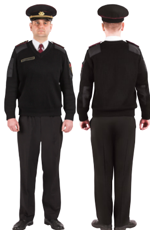
UGUNSDZESĒJS GLĀBĒJS UN INŠPEKTORS